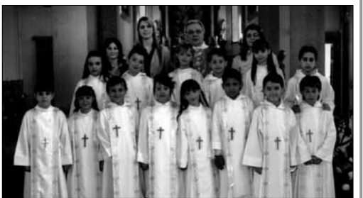
Un importante ricordo: le foto della Prima Comunione (sopra) e della Cresima (sotto), tenutesi nella parrocchia di Sarmato quest'anno.