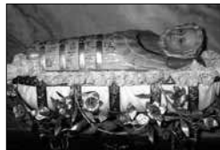
La statua di Maria Bambina nella chiesa di Pievevitta.