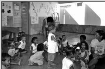
La missione a Picos, in Brasile.

In seguito l'impegno della Diocesi si aprì anche sulla diocesi di Bragança, dove era vescovo il validissimo di Co-