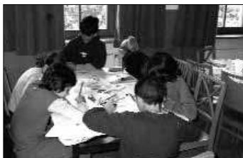
Forse sarà così il doposcuola all'Oratorio.

fa richiesta, dalle ore 13 alle ore 14 il servizio mensa con l'assistenza di un operatore.