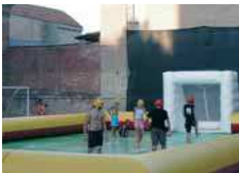
Il torneo di calcio saponato durante la festa di San Rocco.