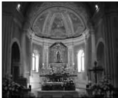
La bella abside della Chiesa di Creta.

Anche la Bibbia riporta tante feste che il popolo di Dio faceva nell'antichità. Basterebbe prendere il capitolo 23 del Levitico dove è riportato il Rituale delle feste dell'anno. Tutte quelle convocazioni festive erano comandate da Dio per far capire al popolo che aveva ricevuto tanti doni, poteva vivere nella gioia se si convertiva a Lui, Dio stesso farà festa con il popolo nella salvezza eterna. E' noto che anche Gesù andava alle