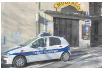
Il cinema Moderno e l'auto dei vigili: immagine della nuova realtà del salone sant'Agnes.

Il Pallaroni ha invece bisogno di una ridefinizione della sua utilità pastorale e di una conseguente ristrutturazione. In attesa di poter realizzare questo processo, impegnativo per la mente e per le finanze, è sembrato opportuno che possa servire ad una attività che verrà incontro alle necessità di molte famiglie e, nello stesso tempo, darà un piccolo contributo finanziario alla parrocchia.