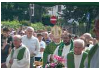
Il Vescovo durante la processione a Poggio Salvini.

Si deve, infatti, esclusivamente alla passione ed all'impegno degli abitanti del Poggio il recente recupero del