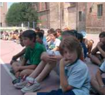
Un momento del GREST nel cortile dell'Oratorio

l'iniziativa della Caritas che ha coinvolto i bambini con giochi e attività volte a sensibilizzare sull'uso dell'acqua e sulla sua importanza in particolare per i popoli del terzo mondo. Progetto che ha poi coinvolto un gruppo di bambini nello spettacolo delle ombre che si è tenuto la sera della festa conclusiva.