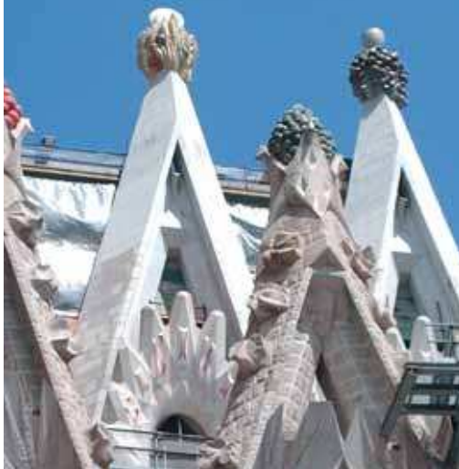
Le torri della "Sagrada Família" della basilica di Barcellona sormontate da grappoli d'uva che rappresentano il frutto spirituale. In alto, accanto, l'interno della chiesa di Agazzino.

La coscienza del carattere incondizionato del dono del Battesimo, ci richiama ad un'apertura radicale ad ogni persona, soprattutto a coloro che vivono la povertà, la fragilità, la sofferenza.