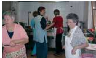
Lo staff di cucina: uno dei perni della vacanza di Pietralba.

"La Comunità è stata vivida una grande orchestra, di cui ognuno rappresenta uno strumento: tutti, facendo la nostra parte, possiamo contribuire all'armonia dell'orchestra" è l'espressione del rapporto della comunità con Dio.