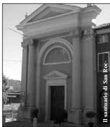
Il santuario di San Rocco.

Questo chiedere, cercare, conoscere, re-