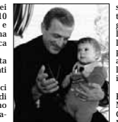
Don Tonino Bello.

Allora la figura di santo che ci aveva guidato era stata quella di Padre Pio. Stavolta incontreremo don Tonino Bello, nativo del Salento e vescovo di Molfetta, Giovinazzo, Terlizzi e Ruvo. Cono-