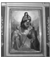
I patroni Sant'Antonio abate e San Savino