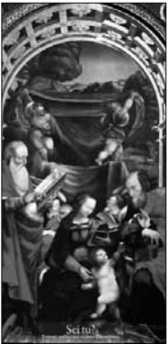
L'immagine dell'Avvento la "Sacra conversazione con Madonna, Bambino, San Girolamo e San Pietro", cappella di San Girolamo chiesa di San Sisto a Piacenza; dipinto di Sebastiano Novelli, circa 1530.

periodo, molto popolare nelle nostre chiese: "Dio s'è fatto come noi, per farci come Lui"; va da sé che, perfettamente, può riuscire soltanto l'opera di Dio, ma non per questo l'uomo è meno tenuto a corrispondere al disegno divino d'amore sulla creazione.